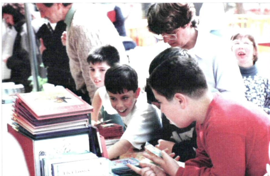
Les llibreries de Sant Boi exposaran les seves ofertes a la plaça de l'Ajuntament