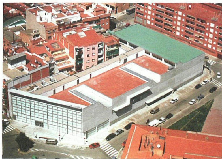
L'Olivera es uno de los equipamientos socioculturales del barrio de Marianao

Las solicitudes presentadas se atenderán en función de