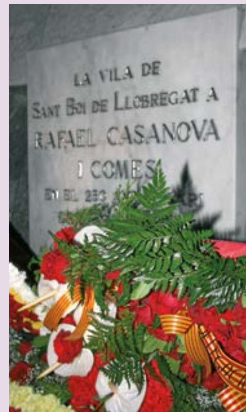
L'ofrena floral se celebra cada any a la tomba de Rafael Casanova, a l'interior de l'església de Sant Baldiri; a fora, la hissada de la senyera dona inici a les activitats