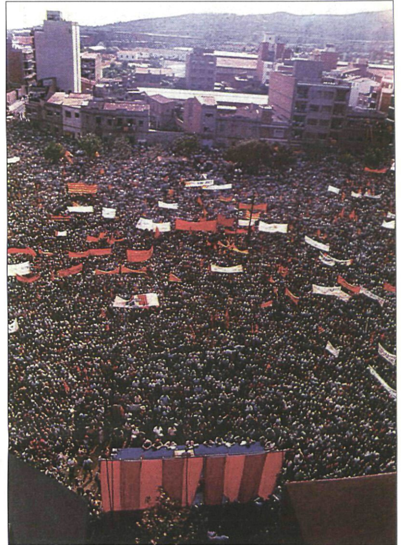
Desenes de milers de persones es van aplegar a la plaça de Catalunya l'any 1976

Tots els ciutadans de Sant Boi estan convidats a participar en aquest esdeveniment que s'iniciarà, a les set de la tarda, a la plaça de l'Ajuntament.