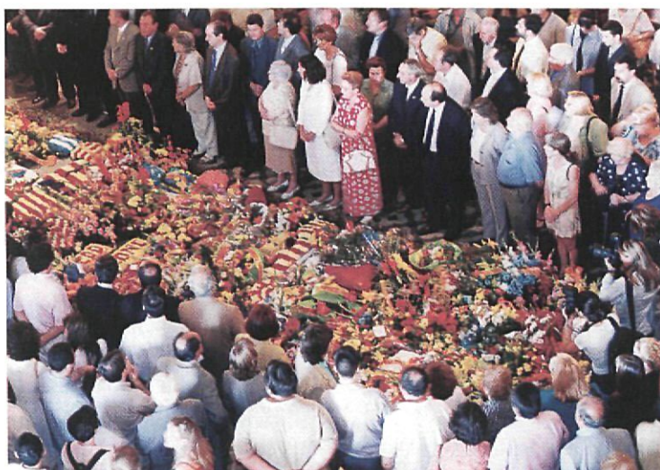
La tomba de Rafael Casanova aplega cada any la classe política, sindical i social del Baix Llobregat

i participin, juntament amb representants de les entitats ciutadanes de Sant Boi, en el desplegament de la senyera.