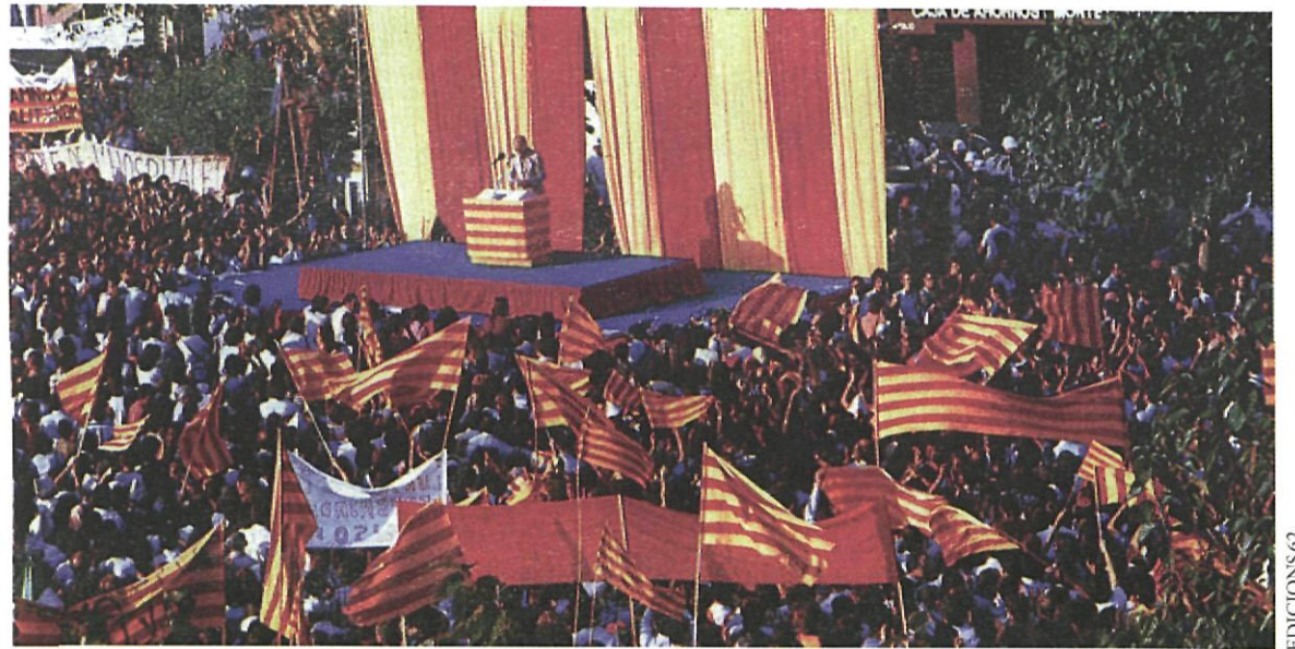
Sant Boi es va convertir en la 'capital de la llibertat'