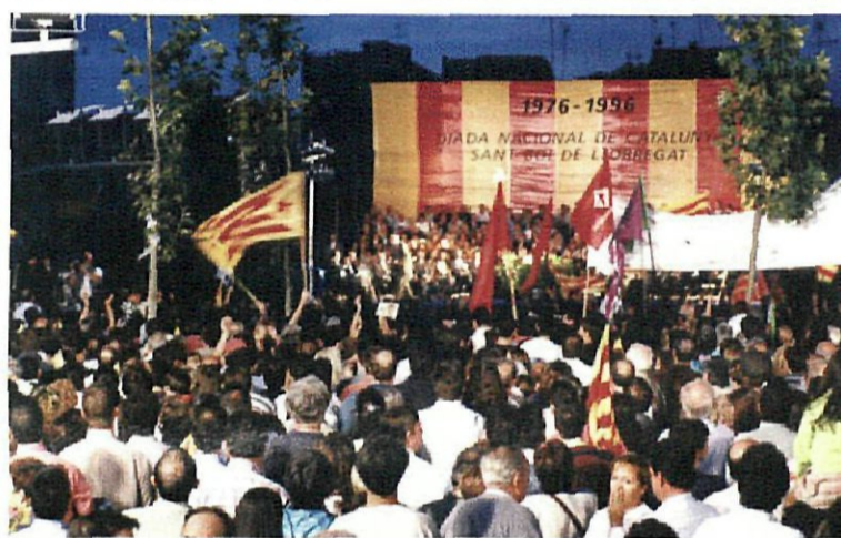
L'any passat, amb motiu del vintè aniversari, la diada va tornar a la plaça de Catalunya