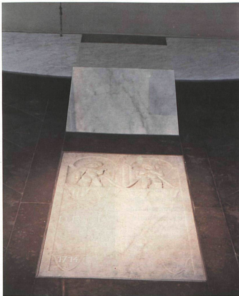
■ Aspecte de la tomba remodelada

A Sant Boi se celebra la Diada Nacional des de l'any 1976, quan totes les forces polítiques i ciutadanes catalanes van convocar a la plaça de Catalunya un acte multitudinari de caràcter reivindicatiu. Rafael Casanova, conseller en cap de Barcelona durant el setge de les tropes borbòniques, va viure a la nostra ciutat durant bona part de la seva vida.