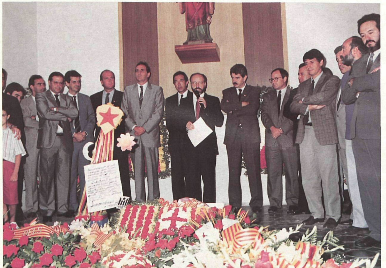
Alcades i autoritats, davant la tomba de Rafael Casanova

Rafael Casanova, que va ser conseller en cap de la ciutat de Barcelona, va viure gran part de la seva vida i fins la seva mort a Sant Boi de Llobregat, a l'edifici conegut com Can Barraquer. Casanova va caure ferit defensant les muralles de Barcelona davant les tropes borbòniques de Felip V el dia 11 de Setembre de l'any 1714. Sant Boi de Llobregat va gaudir de l'honor d'acollir el primer gran acte públic autoritzat des de 1939 per celebrar l'Onze de Setembre, concretament l'any 1976 a la plaça de Catalunya. Des de fa alguns anys, tots els Ajuntaments de la comarca participen en aquest acte conjunt d'homenatge a l'heroi nacional i en commemoració d'aquella primera Diada pre-democràtica.