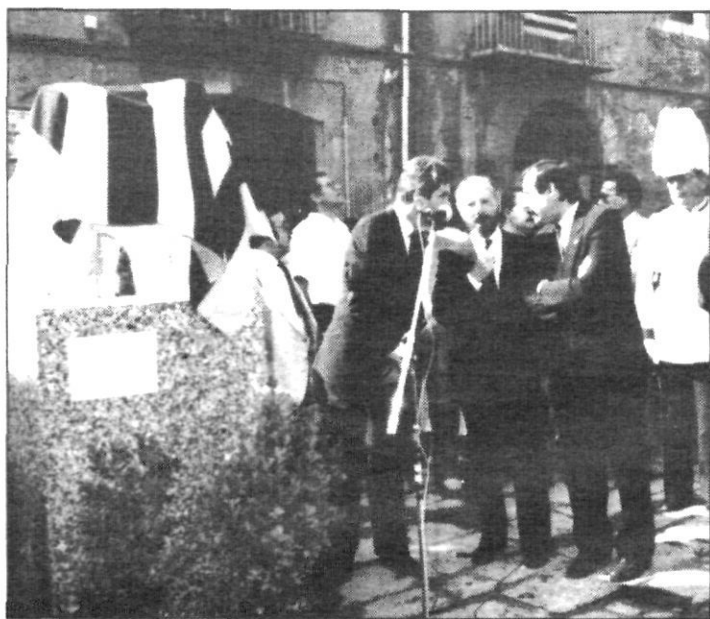
Inauguració del Monument a la Sardana. Diada 1985