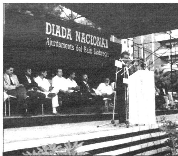
Xé Aniversari de la primera Diada democràtica