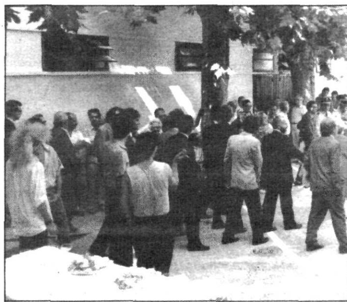
Inauguració del Casal de Mariano. Diada de 1987