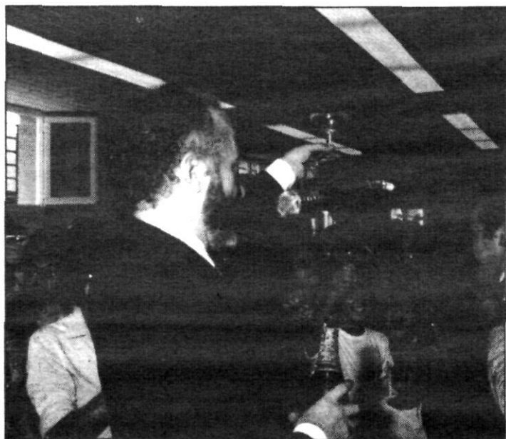
Inauguració del Casal de Camps Blancs. Diada 1986

Un altre any es tornaran a reunir al nostre poble els representants de diverses institucions de Catalunya.