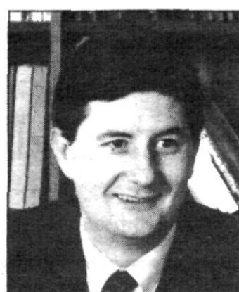
Lluís Tejedor i Ballesteros Alcalde del Prat de Llobregat (Iniciativa per Catalunya)

Fent Poble, fem Comarca i fem Nació. No deixem escapar l'oportunitat de fer de la Diada un punt de retrobament entre vilatans dels nostres Pobles, entre pobles de la nostra Comarca i entre comarques de la nostra Nació.