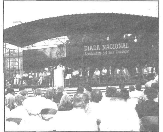
Milers de persones i diverses personalitats polítiques es van concentrar a la Plaça Catalunya

Representants de tots els ajuntaments del Baix Llobregat es van trobar el propassat 11 de setembre a Sant Boi per commemorar el desè aniversari de la primera Diada Nacional de Catalunya celebrada en llibertat el 1976.