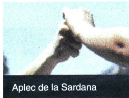
Aplec de la Sardana