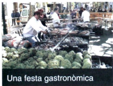
Una festa gastronòmica