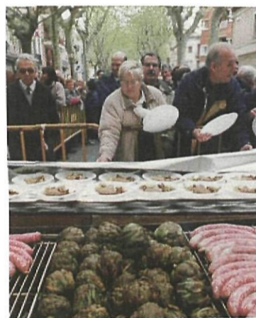
A la primera edició van participar 1.500 persones

El menú del dinar tindrà com a ingredient gairebé monogràfic la carxofa: amanida de carxofa, truita de carxofa,