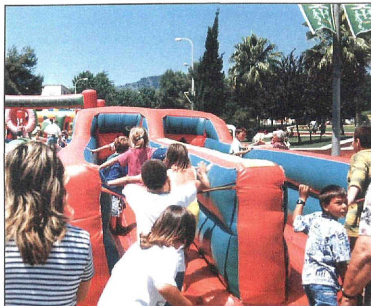
Els infants són protagonistes destacats de les festes de barri

■ Les festes de barri de Sant Boi van sorgir amb la finalitat de promoure la convivència entre els veïns i veïnes dels diferents districtes de la ciutat. Les activitats estan organitzades per les respectives comissions de festes que, cadascuna al seu barri,