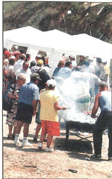
Sardinada, a Ciutat Cooperativa

decideixen quines activitats es realitzen i quines són les dates més apropiades perquè tinguin lloc.