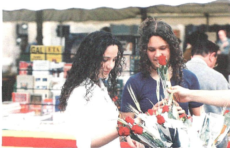
Els llibreters es traslladen a la plaça de l'Ajuntament el 23 d'abril

Sant Boi prepara la celebració de la diada de Sant Jordi més cultural. Circ, teatre, escultura, sardanes, música antiga, cartellisme; literatura històrica, conte, novel·la... Una quinzena d'activitats componen la programació de Sant Jordi 1999. Durant tota la jornada, com és habitual, les llibreries i les biblioteques de la ciutat sortiran al carrer. La Casa de la Vila farà una nova jornada de portes obertes.