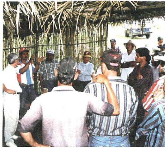
Las entidades constituyeron una asociación para promover el desarrollo

■ Dos técnicos del Ayuntamiento viajaron el pasado mes de marzo a San Miguelito con el objetivo de iniciar los trabajos de elaboración del proyecto y, al mismo tiempo, sentar las bases para profundizar los lazos de solidaridad con San Miguelito, población hermanada con Sant Boi desde 1990.