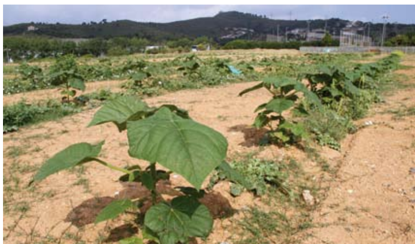
El terreny està al peu de la muntanya de Sant Ramon

L'Ajuntament ha plantat 2.000 exemplars de paulònies en un terreny d'11.000 m 2 situat a Torre de la Vila. La paulònia és una espècie que creix molt ràpidament i es regenera amb facilitat. Els arbres triguen només tres anys a créixer i ho fan fins a set vegades consecutives. Cada cop, la fusta es pot aprofitar tot convertint-la en biomassa, un material orgànic útil com a font d'energia [per a calderes de calefacció i aigua calenta, per exemple]. Amb l'exploració de la finca, l'Ajuntament espera obtenir 140 m 3 de biomassa cada tres anys i contribuir així a la promoció de l'ús d'aquesta energia renovable. Aquest tipus de plantació, anomenada "plantació energètica", és pionera a Catalunya.