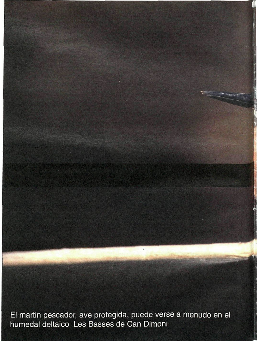
El martin pescador, ave protegida, puede verse a menudo en el humedal deltaico Les Basses de Can Dimoni

importante de especies que utilizan este espacio para hacer un alto en el camino durante su viaje migratorio.