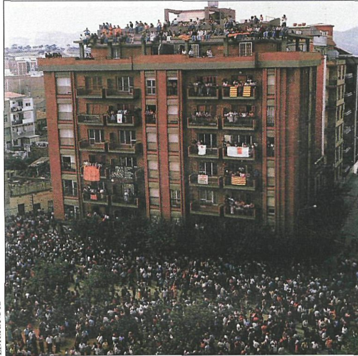
Una multitud es va concentrar a la plaça de Catalunya per la diada de l'any 1976

L'Onze de Setembre vinent es compliran 25 anys de la multitudinària diada de 1976. Sant Boi prepara una celebració amb la dignitat i excel·lència que aquest esdeveniment es mereix. Una gran cercavila ciutadana i un espectacle commemoratiu, coordinats per la companyia teatral Comediants, constituïran la gran cita popular de la jornada. A continuació se celebrarà un acte de reivindicació política.