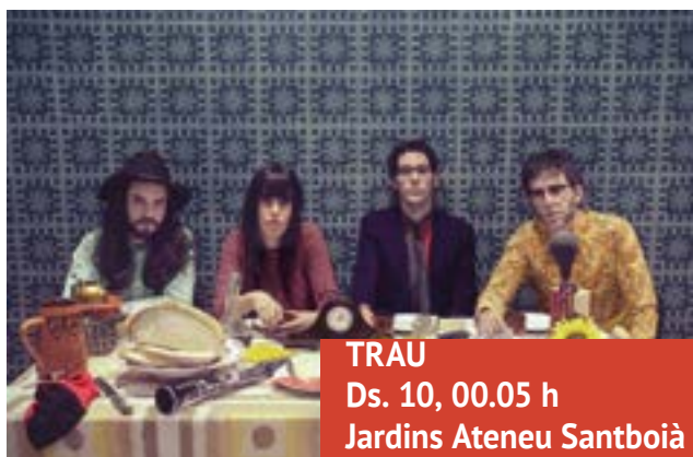
TRAU Ds. 10, 00.05 h Jardins Ateneu Santboià