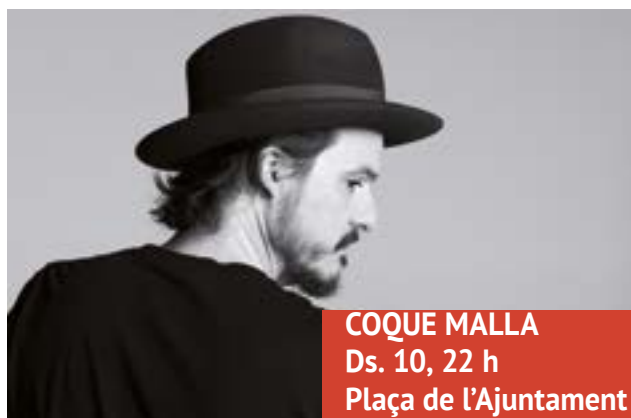
COQUE MALLA Ds. 10, 22 h Plaça de l'Ajuntament