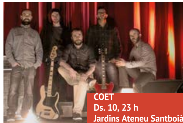
COET Ds. 10, 23 h Jardins Ateneu Santboià