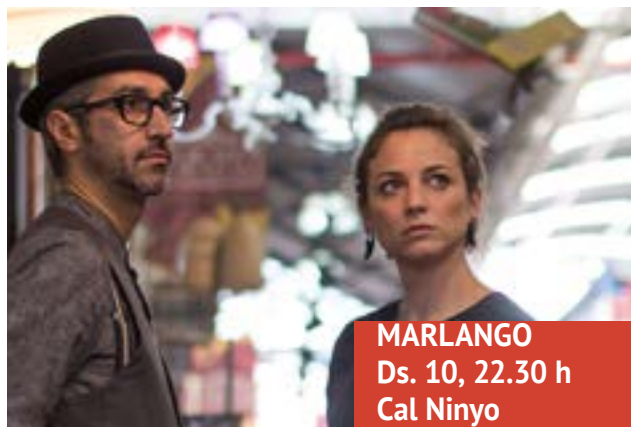
MARLANGO Ds. 10, 22.30 h Cal Ninyo