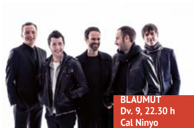
BLAUMUT Dv. 9, 22.30 h Cal Ninyo