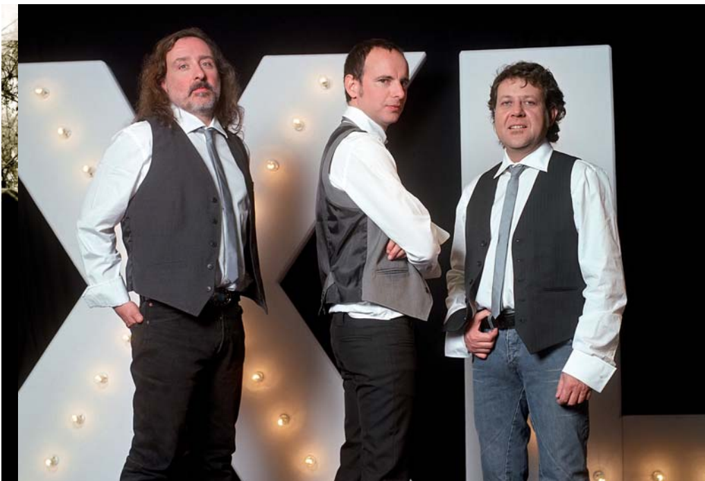
Altaveu gaudirà en aquesta edició de l'impecable directe dels Pets