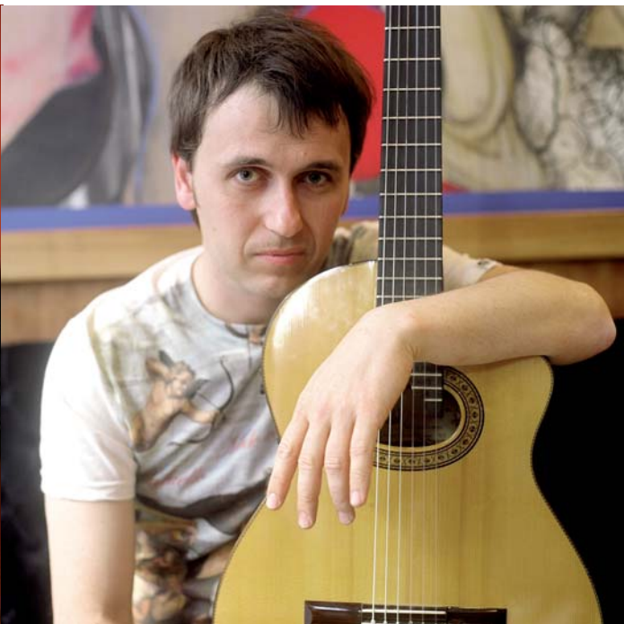
Sanjosex: música d'autor made in l'Empordà