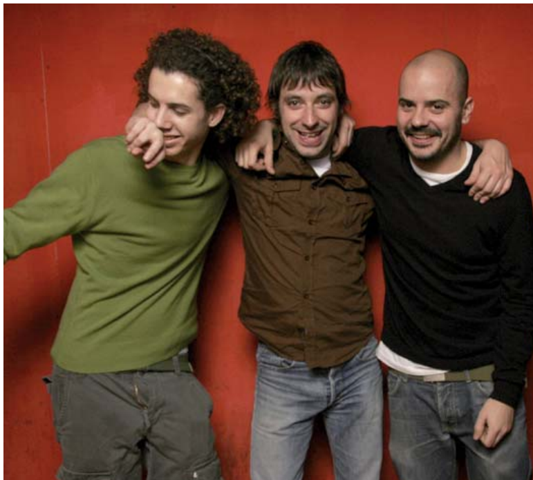
Mazoni, una referència en l'escena independent

Plaça Ajuntament, 22 h (gratuit) Els Pets tocaran finalment a l'Altaveu, després que la pluja ho impedís l'any 2004. Ara ens