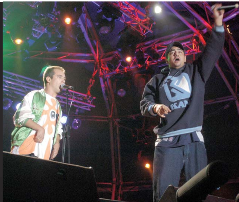
La Excepció: hip hop divertit desde Carabanchel