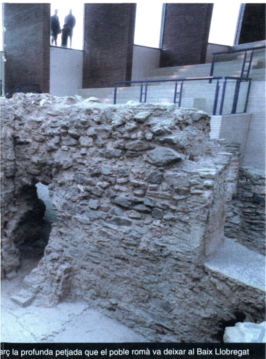
arc la profunda petjada que el poble romà va deixar al Baix Llobregat