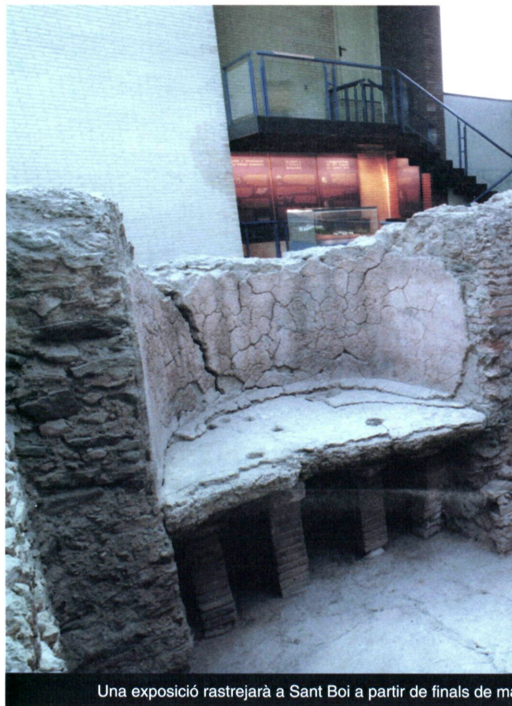
Una exposició rastrejarà a Sant Boi a partir de finals de març

Més propostes. Altres activitats previstes són un cicle de conferències divulgatives que avaluaran, per exemple, els resultats de les darreres excavacions fetes a la ciutat; l'edició d'un llibre divulgatiu sobre les termes; i l'exposició "L'altra història de les Termes", que s'inaugurarà pels volts de la Festa Major i proposarà un recorregut històric per aquests cinquanta anys d'excavacions, oblit, recuperació i exhibició pública del monument.