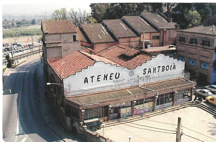
La zona es convertirà en un eix d'atracció cultural i turístic

■ Les línies mestres del futur disseny urbanístic de l'Ateneu Santboià s'inscriuen en els criteris previs de modificació del Pla General Metropolità per a l'àmbit del nucli antic aprovats pel Ple municipal del mes de març. El gran objectiu d'aquesta modificació no és cap altre que recuperar el paper central del nucli antic com a espai aglutinador de la vida de la ciutat. El tinent d'alcalde Miquel Àngel Jansà afirma que, per fer-ho possible, "es proposaran mesures per fer créixer el nombre d'habitants, potenciar el comerç tradicional, racionalitzar la circulació i l'aparcament i crear eixos de passeig". Els criteris previs de modificació descriuen dotze unitats d'actuació urbanística en la zona. L'Ateneu Santboià, Can Castellet, Can Boneu, l'entorn del carrer Hospital i l'obertura del carrer Cerdanya en són algunes. L'Ajuntament considera prioritari intervenir a la plaça de l'antic mercat de Sant Josep, Cal Ninyo, Can Jordana i la Torre del Sol.