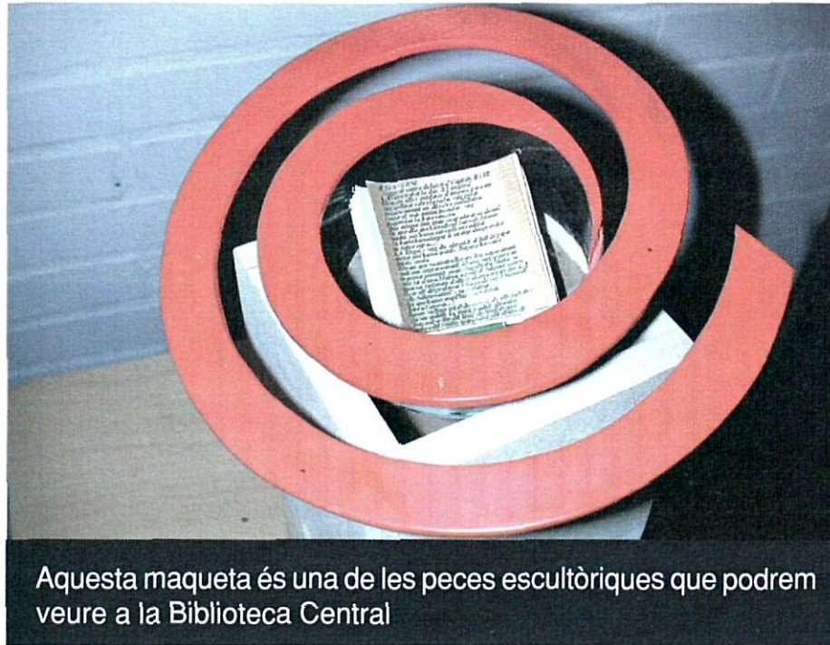
Aquesta maqueta és una de les peces escultòriques que podrem veure a la Biblioteca Central

«El llenguatge de les flors», un passeig per la literatura universal. Aquesta seria una bona frase per resumir el projecte «El llenguatge de les flors» que l'Ajuntament portarà a terme amb l'entitat Centre Cultural Imaginari Kiku Mistu (CCI) i que envoltarà la futura Biblioteca Central amb 13 escultures interactives amb frases i llibres d'autors internacionals. El projecte també podria resumir-se amb les paraules: pedagògic, participatiu i interactiu, ja que és un bon exemple d'aquestes definicions. L'Ajuntament i el CCI han signat un conveni per regular totes les condicions.