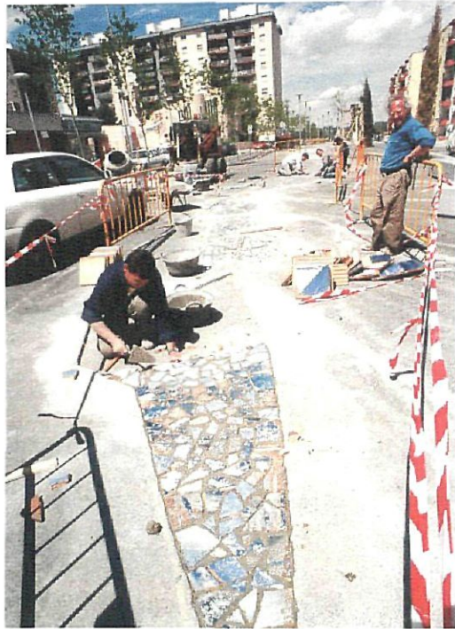
El mosaico es obra del ceramista Joan Gardy Artigas

Las obras de remodelación de la avenida Pau Casals quedarán pronto culminadas. La colocación del mosaico modernista Homenatge a Gaudí y la ampliación de la jardinería pondrán el colofón a la conversión de la avenida, uno de los ejes neurálgicos de Ciutat Cooperativa, en una rambla. La instalación del mencionado elemento artístico permitirá que el barrio quede integrado en la Ruta de la Memoria, un futuro itinerario turístico.