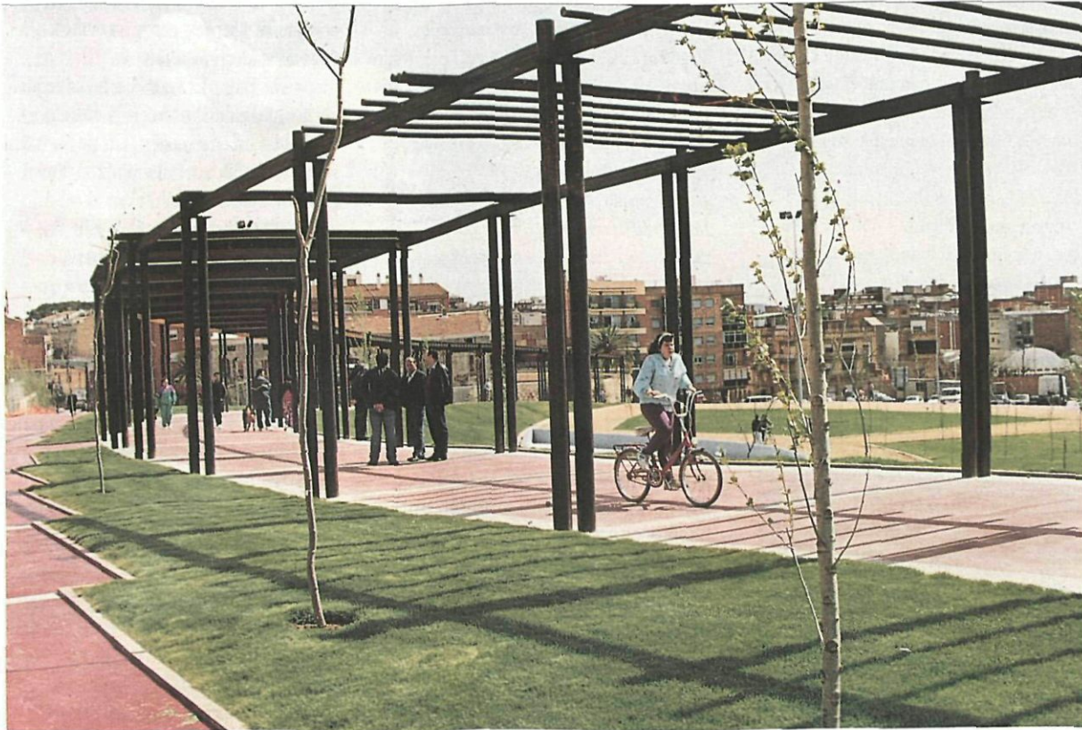
■ El parque de la Muntanyeta, un pulmón verde para Sant Boi

La escultura Diosa del Agua se colocará en el lago artificial del interior del recinto